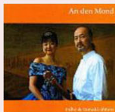
月に寄す Parmigiano records 2004年6月録音 ¥2000