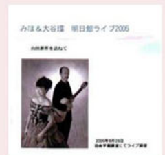
明日館ライブ 山田耕作を訪ねて 2005年8月28日 ライブ録音 ¥1200