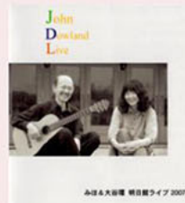
明日館ライブ ダウランド～憂いの音楽 2007年9月17日 ライブ録音 ¥1200