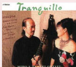
Tranquillo Victor 2002年5月録音 ¥1200