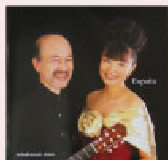
エスパーニャ PGR-2160 2009年6月録音 ¥2000