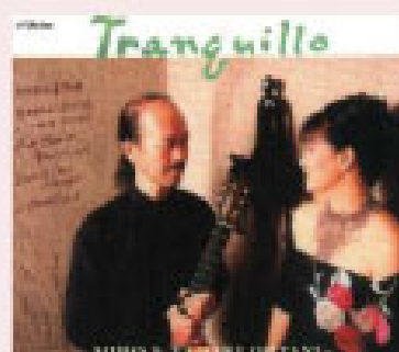
Tranquillo Victor 2002年5月録音 ¥1200