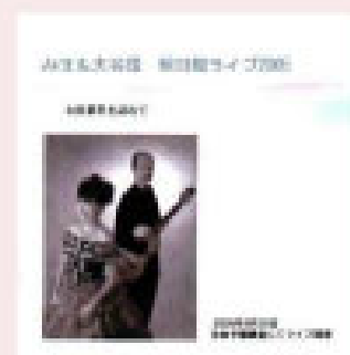
明日館ライブ 山田耕筰を訪ねて 2005年8月28日 ライブ録音 ¥1200