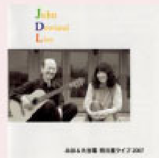
明日館ライブ ダウランド〜憂いの音楽 2007年9月17日 ライブ録音 ¥1200